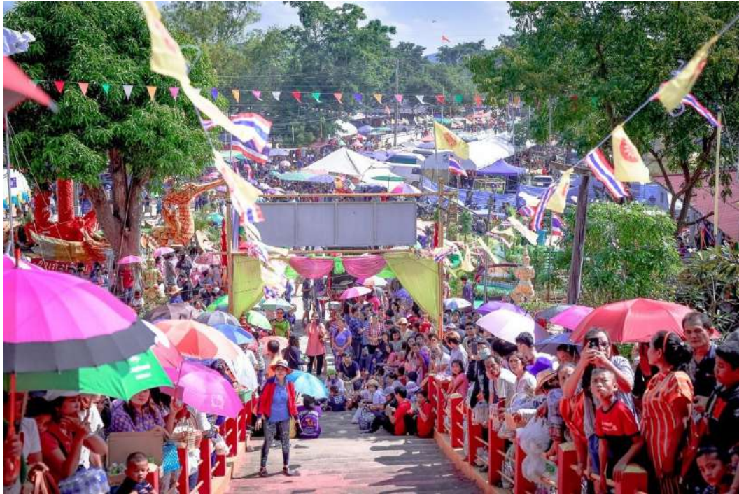
ประเพณีสงกรานต์และวันกตัญญูผู้สูงอายุ