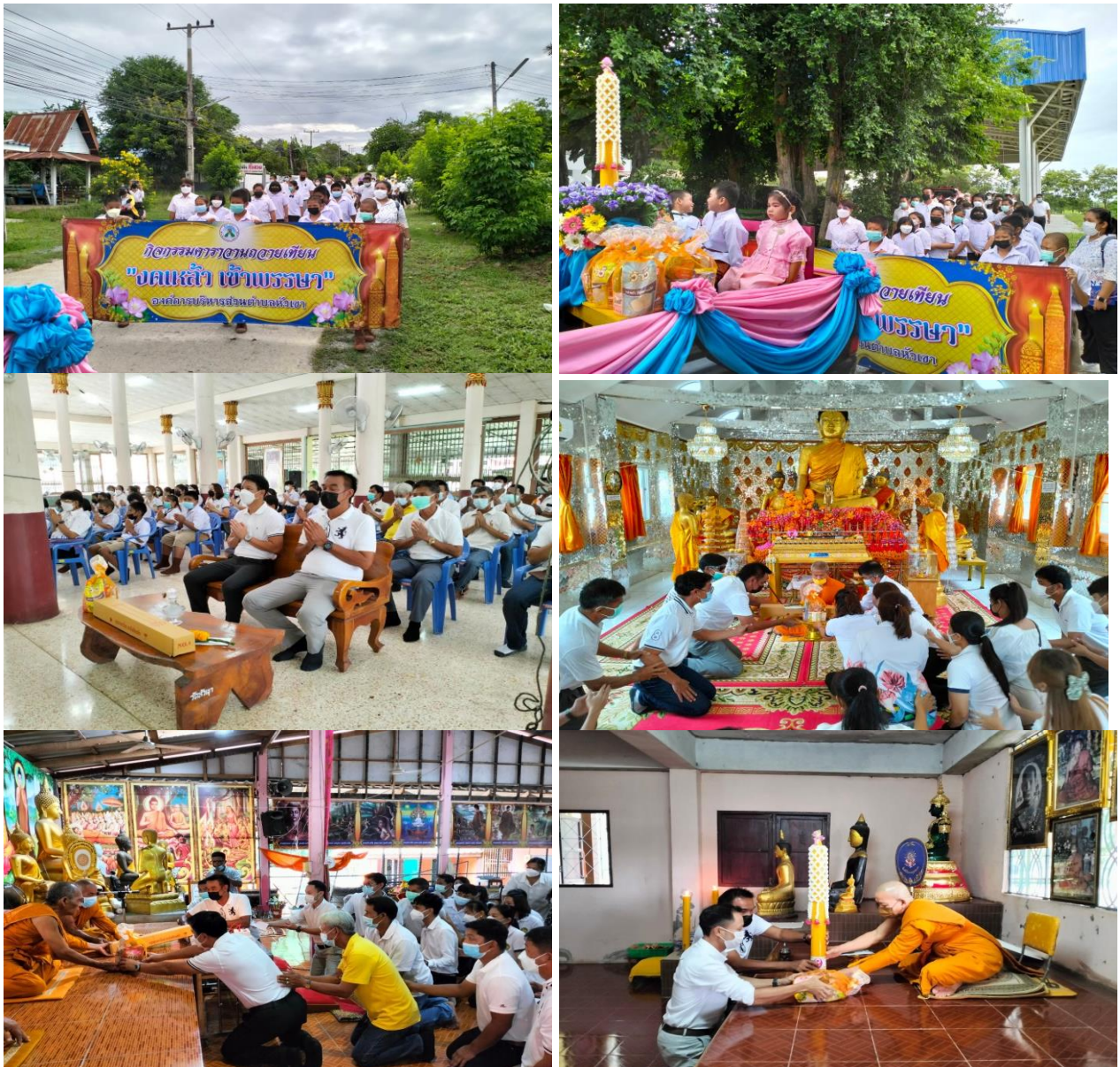
ภาพกิจกรรมที่สำคัญตามนโยบายด้านศาสนา วัฒนธรรม จารีตประเพณีและภูมิปัญญาท้องถิ่น กิจกรรมส่งเสริมประเพณีแห่เทียน เนื่องในวันออกพรรษา ไม่ใช้งบประมาณ